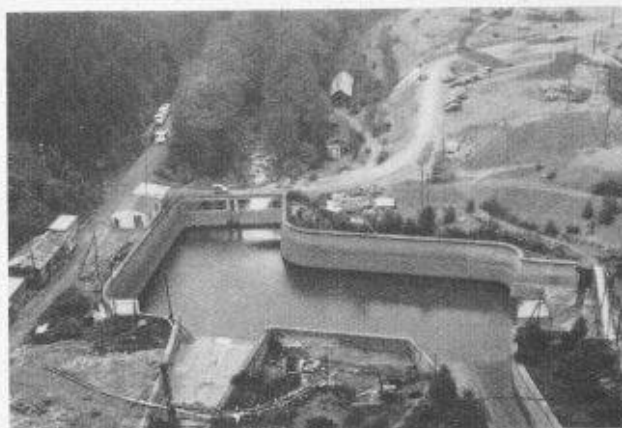
Fig. 2. — Barrage sur la Vesdre. — Bassin de décharge.

point pour résoudre graphiquement les problèmes d'élasticité plane. C'est dans ce même institut que se réunirent les congressistes pour la dernière séance de travail, ce qui leur donna l'occasion d'admirer la parfaite reconstruction des bâtiments des Instituts universitaires du Val Benoît, ainsi que les différents locaux d'essais de l'Institut du génie civil et en particulier le laboratoire de photoélasticité de M. A. Pirard.