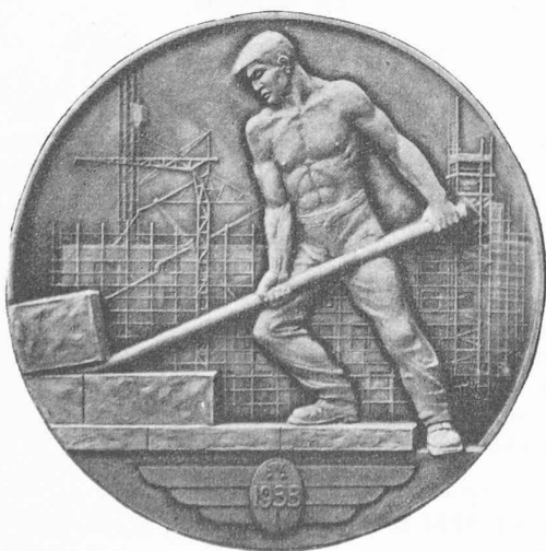
Fig. 6a. — Le Palais de la SDN (avers).

Ce n'est que vers 1930, en Suisse, que les médailleurs commencent à s'intéresser aux réalisations contemporaines des architectes et des ingénieurs civils. La belle médaille de Burkhard pour le pont de Lorraine, à Berne (fig. 5), est une composition encore toute classique, elle peut être comparée au revers de la médaille de Bramante, mais elle est combien plus harmonieuse : la synthèse entre le pont et le nu féminin dont le geste allégorique unit les deux rives est parfaite. La médaille du Palais de la S. d. N. (fig. 6a-6b), par H. Jacot (1933), est plus entièrement consacrée à l'art de la construction, mais le palais lui-même est encore relégué au revers... ce qui en l'occurrence n'est pas un mal ! Ces deux artistes évitent d'aborder de front le problème de l'interprétation des œuvres