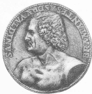
Fig. 1a. — Bramante (avers).