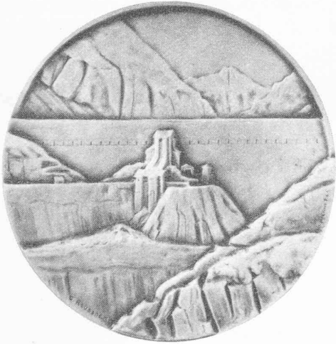
Fig. 7. — Dixence.

de la technique contemporaine, ils font encore appel, avec bonheur du reste, à la figure humaine, à la composition, et ils hésitent à reconnaître la beauté de l'œuvre purement technique. Méfiance compréhensible envers cette technique qui a engendré tant d'horreurs avant d'oser être elle-même.