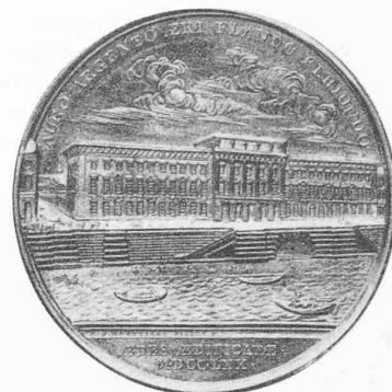
Fig. 4. — L'Hôtel des Monnaies.