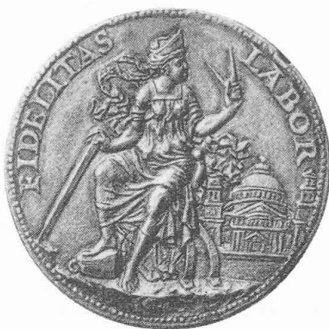
Fig. 1b. — Bramante (revers).