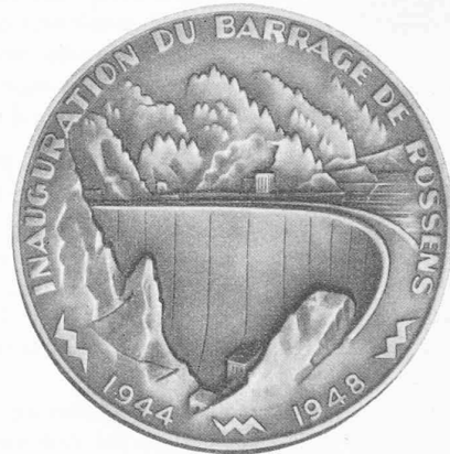
Fig. 9. — Rossens.

Les médailles des figures 5 à 9 ont été éditées par Huguenin Frères, Le Locle.