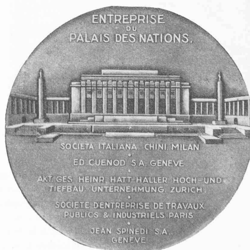
Fig. 6b. — Le Palais de la SDN (revers).