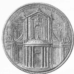
Fig. 2. Santa Maria della Pace.