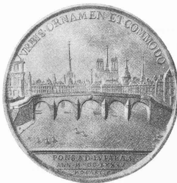
Fig. 3. — Le Pont Royal.