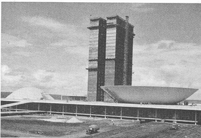
Brasilia. Palais des Congrès (à gauche le Sénat, au centre le bâtiment administratif, à droite la Chambre des Députés)

Vol Bahia-Brasilia , réception par notre compatriote, W. Stäubli, ing. S.I.A., qui se dépense sans compter pour nous faire profiter au maximum de notre séjour d'une journée et demie dans cette nouvelle capitale née dans la savane, créée de toutes pièces et qui constitue un immense chantier où l'on travaille fébrilement partout à la fois, nuit et jour, obsédé par la date fatidique du 21 avril fixée pour l'inauguration officielle. Le paysage est doux, harmonieux, la végétation clairsemée, l'horizon immense. La température est très agréable. Visite du très beau Palais de l'Alvorada (palais de l'Aube), future résidence du président, du palais des congrès qui comprend le Sénat,