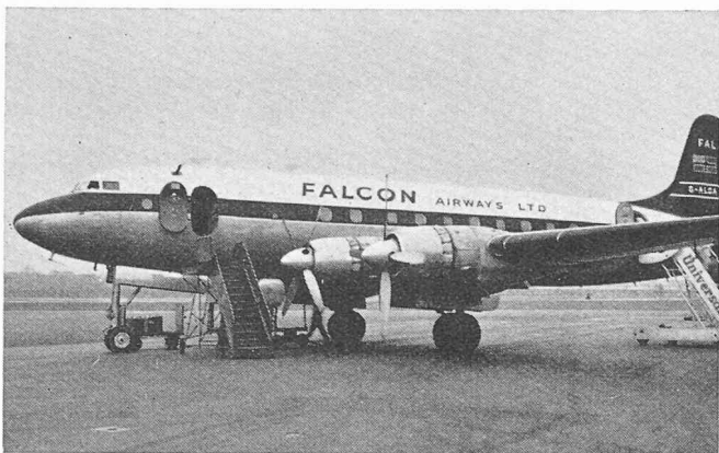
Le « Falcon »

Ce voyage a rencontré le plus grand intérêt parmi les membres de la S.I.A., puisque plusieurs inscriptions n'ont pu être prises en considération. C'est donc que le « Falcon »,