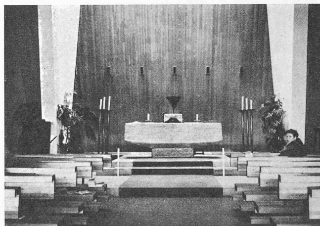
La figure 2 montre l'autel et la face arrière, où l'on distingue nettement cinq des neuf tuyères de pulsion installées. On constate que ces tuyères, qui s'incorporent parfaitement au caractère de l'édifice, sont tout à la fois un élément fonctionnel et décoratif.

A titre d'exemple, nous aimerions évoquer l'église de Sainte-Marie-Madeleine, de Troinex, qui constitue une solution intéressante. Il s'agit d'un édifice moderne et