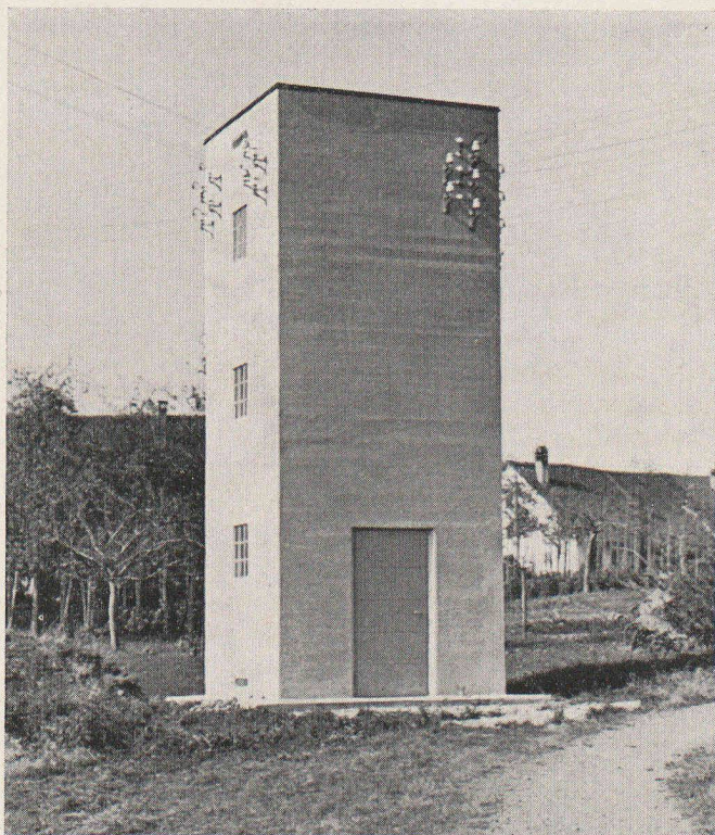
Exemple d'une station de transformateur purement utilitaire. Date de construction : env. 1930 *

Plus les frais d'acquisition (montage y compris) sont élevés, plus les fractions constantes du coût annuel apparaissent également élevées. Pour les frais d'exploitation, les conditions sont en général inverses, c'est-à-dire qu'ils baissent lorsque le capital investi est plus important. Si l'on additionne les deux composantes, il en résulte en général une courbe qui présente un minimum plus ou moins accusé pour le coût annuel.