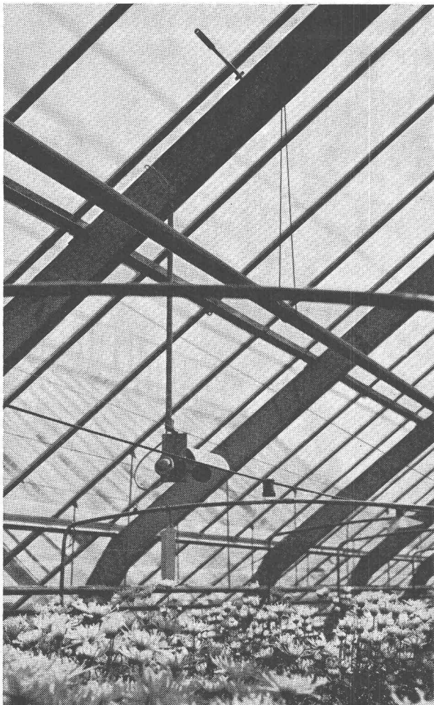
Serre avec contrôle de la température en fonction de la lumière du jour.

En haut : sonde d'éclaircement (photorésistance).