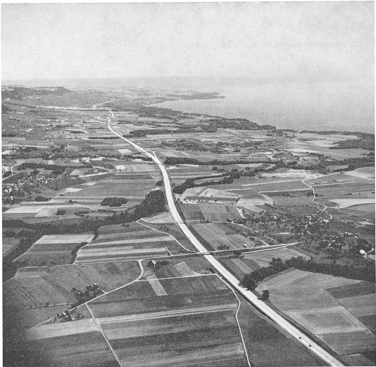
Fig. 1. — Tronçon de l'autoroute dans la région de Nyon-Gland.

le problème essentiel est de quelle manière on compactera les remblais. Dans la plupart des cas, c'est la teneur en eau du matériel à remblayer qui est déterminante pour le compactage. Les périodes de pluie obligent l'entrepreneur à suspendre les travaux de terrassement. Après une pluie, il faut laisser sécher les terrains, ce qui demande en général une semaine. A part les terrains graveleux, presque tous les sols sont sensibles à la teneur en eau pour la formation des remblais et pour le compactage ; en Suisse, ils dépassent souvent l'humidité de l'optimum de Proctor. L'entrepreneur est obligé de tenir à sa disposition un petit laboratoire géotechnique pour contrôler les caractéristiques des divers matériaux et pour déterminer le genre de machine le mieux approprié aux compactages.