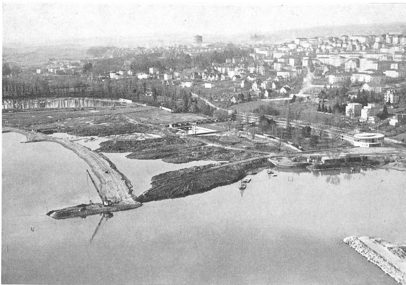
Fig. 6. — Etat des travaux au 27 février 1961 ; vue prise de l'est. S'avancant dans le lac, la digue sur laquelle s'appuie la nouvelle grève qui s'éloigne en direction de l'ouest ; sur la gauche, se reflétant dans l'eau, les balises du piquetage et, le long de la grève, les épis de retenue du sable. Au centre, le comblement devant Bellerive-Plage ; trois mois plus tard, les « lagunes » intérieures auront disparu, le terrain sera réglé et en majeure partie engazonné.

Les travaux ont été conduits de la manière suivante : le vent dominant étant celui du sud-ouest, le chantier a débuté à son extrémité ouest. Pour toute la partie centrale, une levée de terre exécutée sous la couverture d'une digue existante a permis d'atteindre la zone de travail ; un bon accès terrestre étant ainsi assuré, les machines, pelles mécaniques et bulldozers ont pu procéder à la mise en place des matériaux amenés par chalands, exception faite du filtre et de certains enrochements transportés par camions. Les ouvrages de protection ont ainsi progressé d'ouest en est, sans être pris à revers par les vagues de vent ; la plate-forme créée à l'avancement avait une largeur suffisante pour assurer