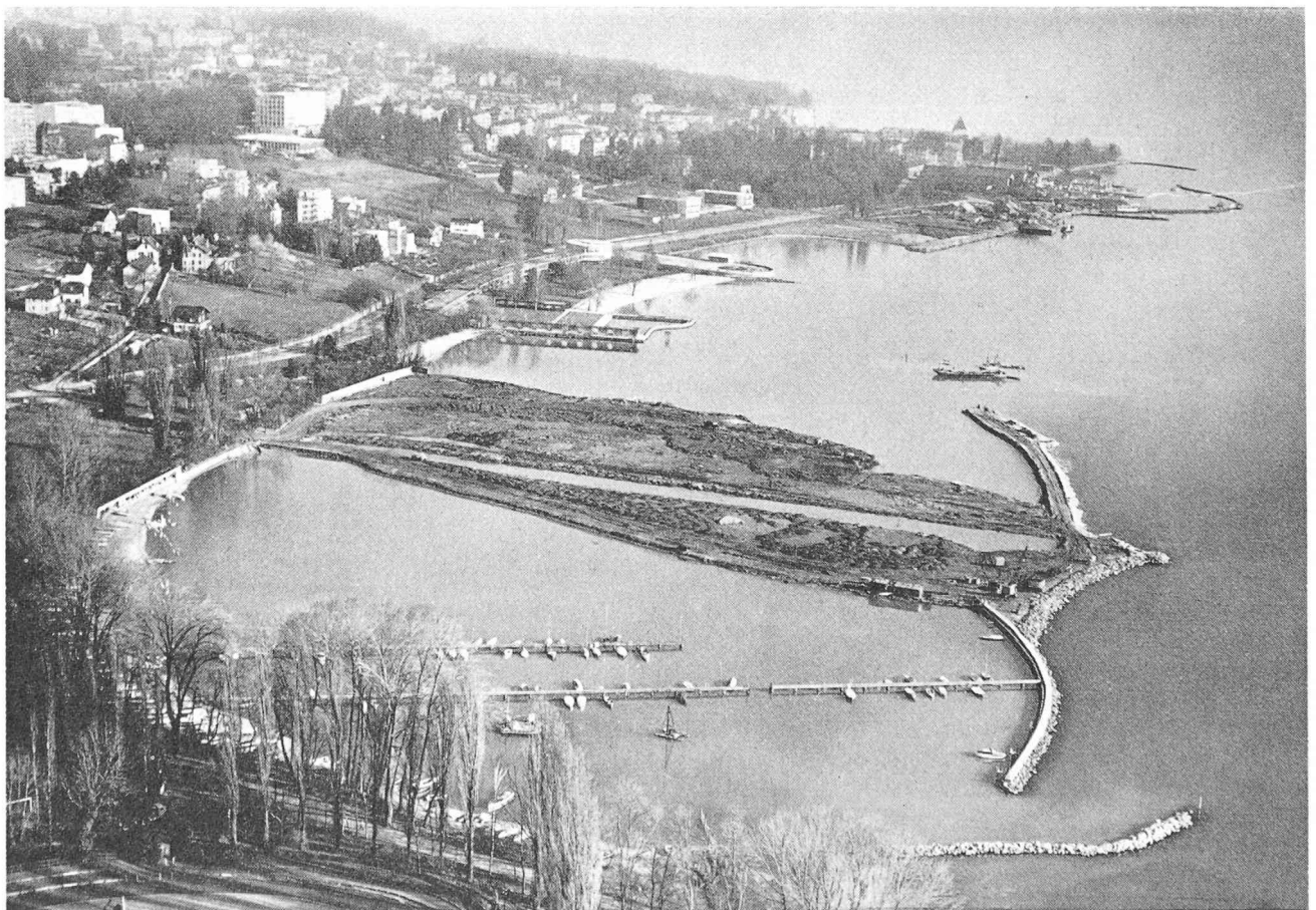
Fig. 5. — Etat des travaux au 1 er février 1960 ; vue prise de l'ouest.

A la pointe et sur rive est du Flon, un premier comblement bordé du côté du large par une digue rectiligne, en enrochements, de quelque 250 m de long, protège un port de petite batellerie dont le bassin a, en moyenne,