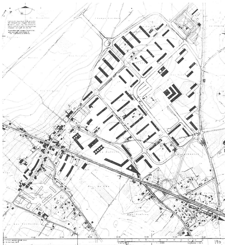
Cité satellite de Meyrin. Plan général.

D'autres ressources devront être obtenues par l'emprunt, mais causent du souci à l'autorité communale, car quelle va être l'assiette fiscale de cette jeune cité ?