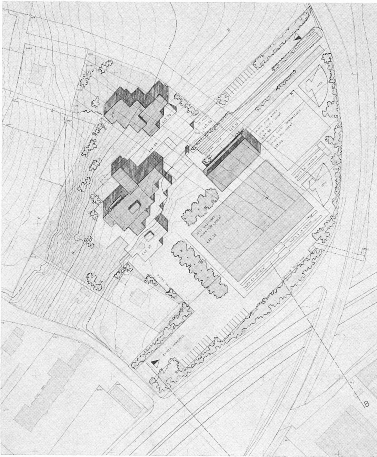
Plan de situation. Echelle 1 : 2500.