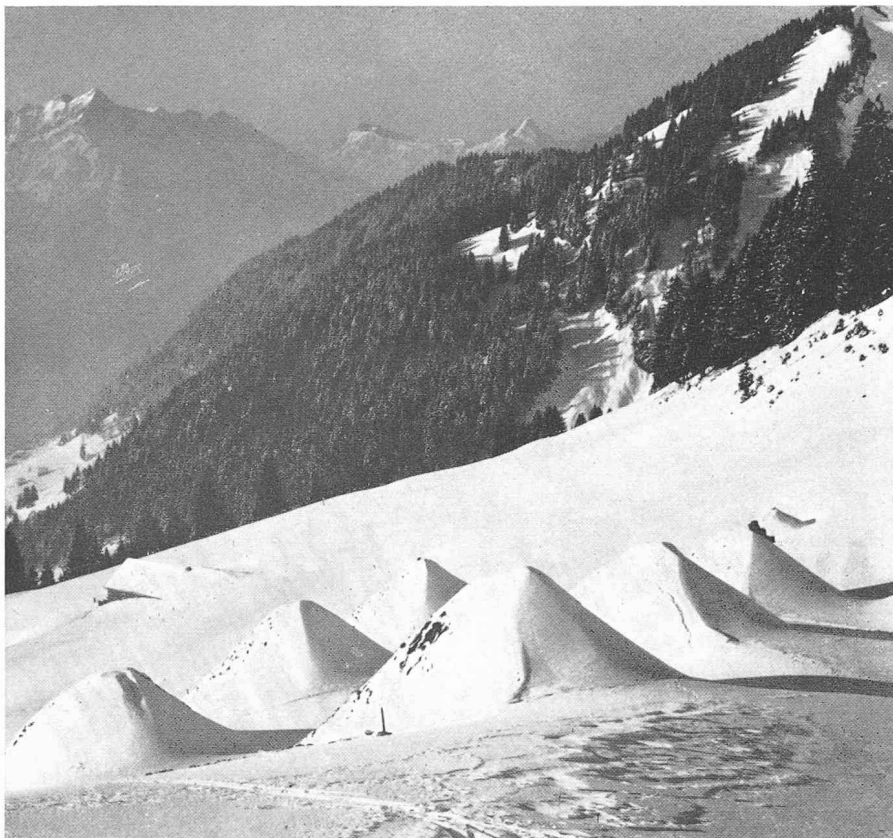
Freins d'avalanches constitués par des monticules artificiels en terre.