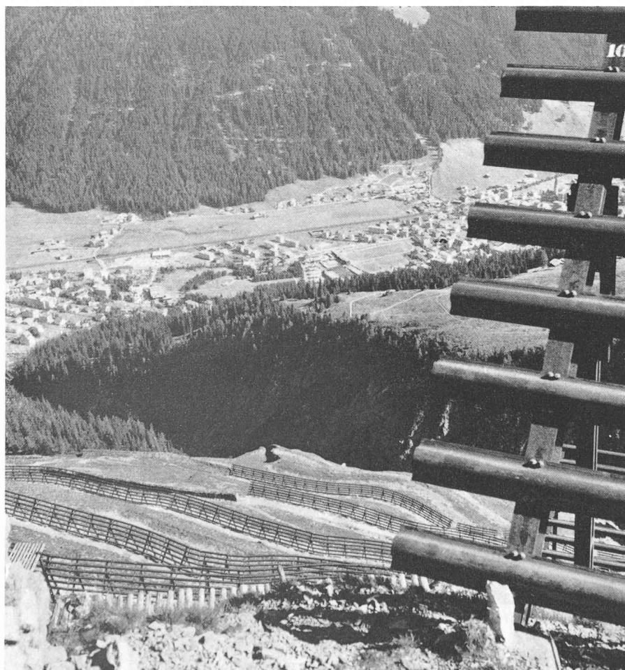
Pare-avalanches en acier.