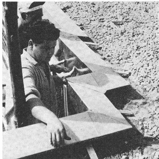
Pose des cornières de support préfabriquées

Voici le processus : dès que la dalle-couverture en béton, ou le béton de pente allant jusqu'en façade sont durcis, les cornières de support et les pierres de bordure préfabriquées peuvent être posées. Même par temps humide. Deux solutions pour la pose des pierres : une colle synthétique à deux composants ou un mortier spécial.