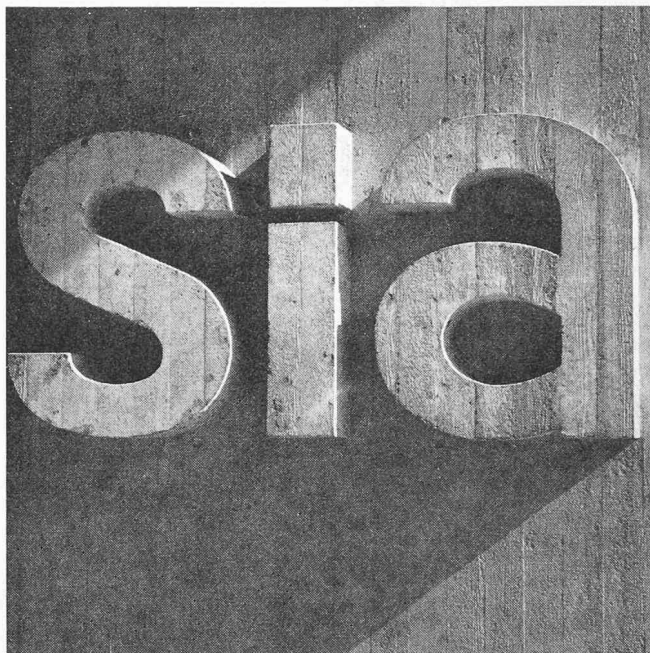
Ce sigle vous accueillera à l'entrée de la maison SIA.

Ce groupe a organisé, en collaboration avec l'Association suisse de fabricants d'objets en matière plastique un séminaire sur les matières plastiques et notamment sur l'emploi