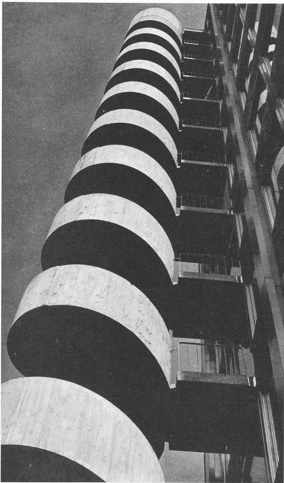
L'escalier de secours sur la façade nord-ouest de la maison SIA