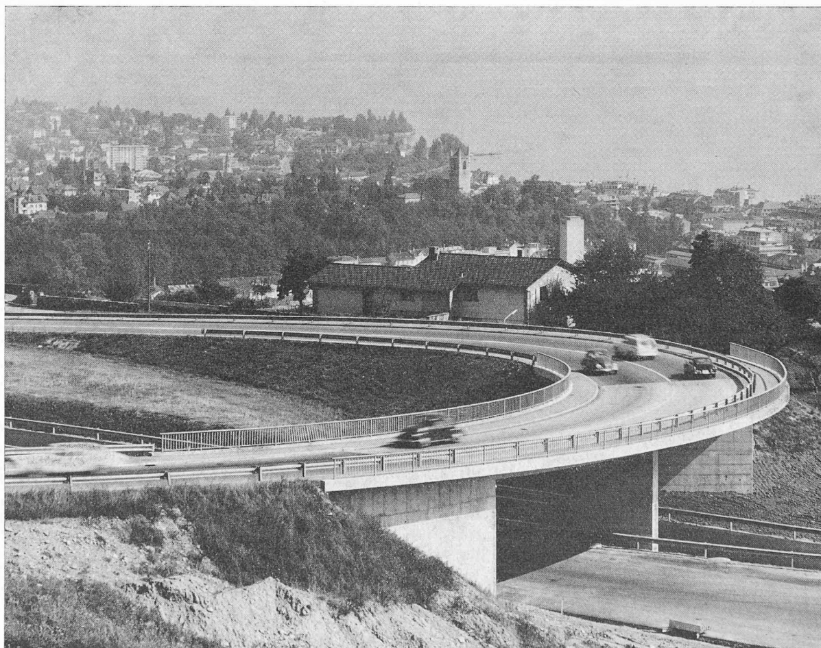
Fig. 1. — Le pont de Beau-Site et la route cantonale n° 744 ; au fond : Vevey.

En effet, les deux tronçons de la nouvelle route se coupent en formant un angle de 25^\circ dont le sommet est situé sur l'autoroute. La topographie des constructions existantes a obligé de réaliser le raccordement par un cercle de 50 m de rayon, sur lequel vient se placer l'ouvrage décrit ci-après.