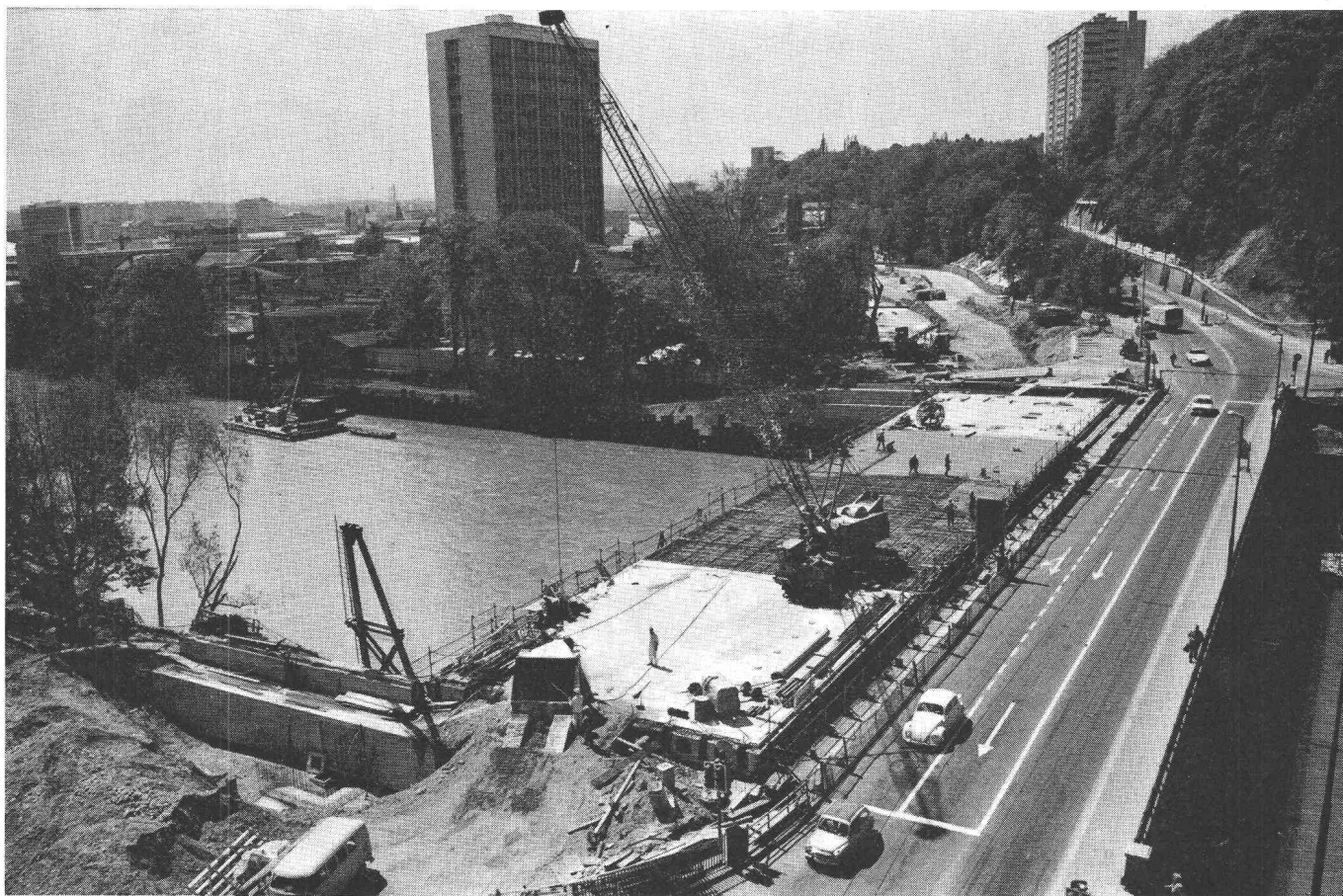
Pont de Saint-Georges sur l'Arve, Genève; Bétonnage du tablier sur éléments préfabriqués Maître de l'ouvrage: Département des travaux publics, Genève Ingénieurs: Bourquin & Stencek, Genève; Société Générale pour l'Industrie, Genève