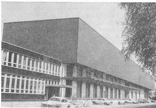
Fig. 2. — Façade en Colour Galbestos : bâtiment industriel à Genève (Bois et matériaux de construction SA. Architectes : Hermès et C ie , Genève).

Si les flammes ne le traversent pas, une élévation de température se produit toutefois sur la face non exposée au feu. Il va de soi que l'aménagement intérieur d'un immeuble doit tenir compte de ce fait, pour bénéficier de la résistance au feu de la paroi. Or c'est précisément ce que les constructeurs de Summerland ont négligé, puisqu'un revêtement en fibres hautement combustibles et facilement inflammables se trouvait à proximité immédiate de la paroi, permettant l'extension du sinistre que l'on sait.