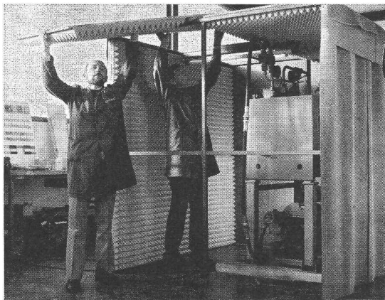
Montage d'une cabine anti-bruit

Les nuisances du bruit se font remarquer dans tous les domaines. Le bruit trop excessif présente un grand danger pour notre environnement.