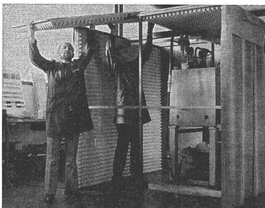
Montage d'une cabine antibruit

Les nuisances du bruit se font remarquer dans tous les domaines. Le bruit trop excessif présente un grand danger pour notre environnement.