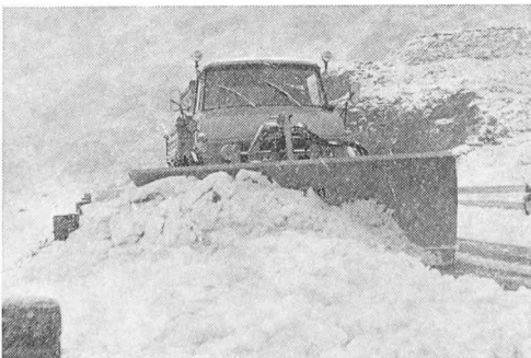
Chasse-neige Boschung en action

Sécurité routière : supports de panneaux de signalisation, véhicules de signalisation, remorques et containers spécialisés, telle est la gamme que la maison Boschung met au service de