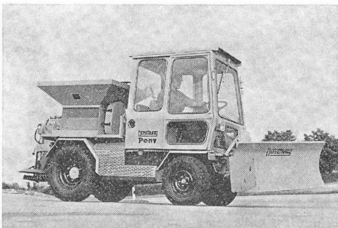
Le Pony Boschung équipé d'un chasse-neige et d'un distributeur de produit de dégel.

Une Suisse propre : le Pony Boschung, nouveau véhicule universel au service des communes et des administrations cantonales, comme des entreprises privées, offre une cabine panoramique de sécurité à deux places et est entraîné par un moteur VW de 40 ch sur 2 ou 4 roues. Verrouillage du différentiel, 6 vitesses avant et 6 vitesses arrière, ainsi qu'un rayon de braquage de 3 mètres seulement lui permettent d'accéder partout. La commande hydraulique de la vitesse tous-terrains, les points d'attache prévus pour une multitude d'accessoires à l'avant et à l'arrière du véhicule et les prises de force aussi bien à l'avant qu'à l'arrière en font un véhicule d'emploi universel.