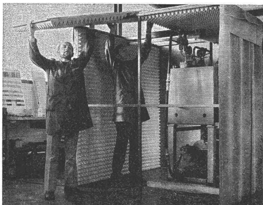
Montage d'une cabine anti-bruit

Les nuisances du bruit se font remarquer dans tous les domaines. Le bruit trop excessif présente un grand danger pour notre environnement.