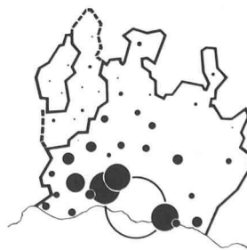
Fig. 2. — Communes de la région de Lausanne et accroissement relatif de leur population résidente.

urbaines ont commencé à s'accroître de façon inattendue (fig. 1). Ce sont principalement les périphéries et les ceintures des anciennes villes qui ont vécu cet accroissement explosif (fig. 2). Ce n'est pas seulement l'occupation du sol en général qui a changé. Au sein des anciennes cités,