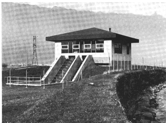
Station de relevage des eaux de décharge de la commune de Wilderswil.