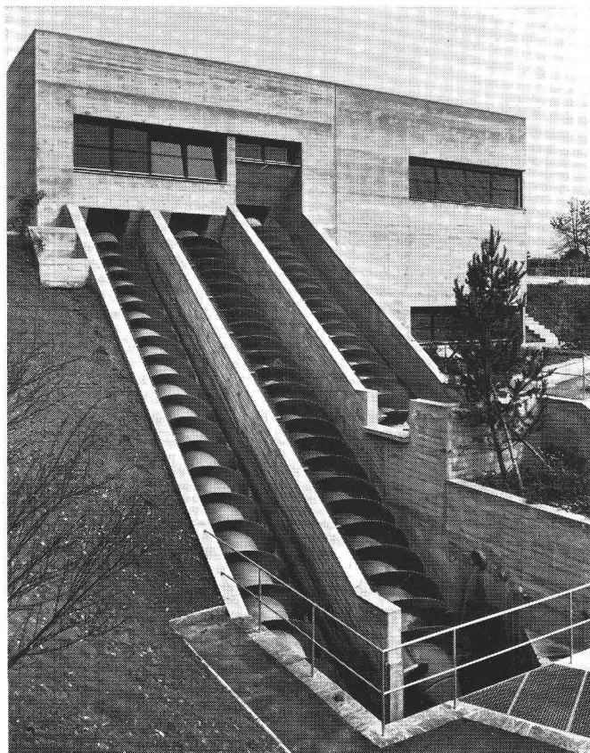
Station d'élévation pour eaux usées avec vis d'Archimède dans l'installation d'épuration de la ville d'Olten.

Les engins d'élévation avec vis d'Archimède SPAANS constituent la solution idéale pour le refoulement d'eaux usées brutes et de boue. Les vis d'Archimède SPAANS sont fabriquées depuis plus de 50 ans et se caractérisent par leur robustesse et leur fiabilité.