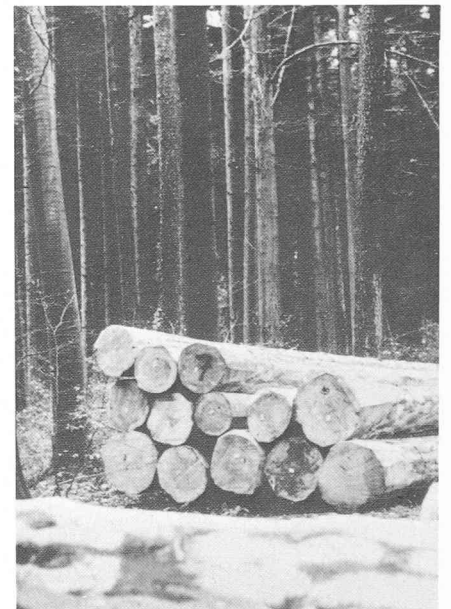
Le bois pousse sur le bois en ne faisant appel qu'à l'énergie gratuite fournie par le soleil et dégageant de l'oxygène si précieux. Pour reconstituer, entretenir ou conserver la forêt dans le meilleur état possible, il faut abattre des arbres.

s'ensuivit qui conduisit à l'engagement d'un personnel forestier compétent et responsable ainsi qu'à l'introduction d'un article dans la constitution tendant à la protection des forêts de montagne qui devait donner jour par la suite à la Loi fédérale sur la police des forêts. Cela eut pour conséquence la plantation de nombreuses nouvelles surfaces forestières dans un but de protection, ainsi que l'assainissement et la conservation efficace des forêts existantes.