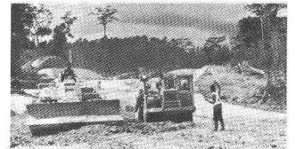
Photo du bas: Voie Express du nord Abidjan-N'Douci, Côte d'Ivoire, 1975-81. Autoroute à 2x2 voies reliant Abidjan au nord du pays: Longueur des 1 re et 2 e étapes: env. 190 km.

Ces ouvrages ont été réalisés en association avec une ou plusieurs entreprises.