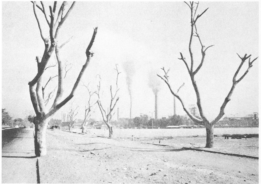
Fig. 1. — La Cimenterie de Turah à 15 km au sud du Caire.

A divers niveaux, les méthodes de modélisation ont été au cœur du travail, parce que particulièrement adaptées au caractère prospectif de l'étude de la pollution à Suez, permettant d'évaluer l'incidence sur la pollution de divers paramètres : développement urbain et industriel, degré de contrôle des émissions.