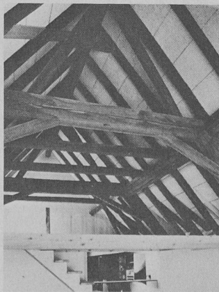
600 m 2 de Schichtex Spécial 75/III , face visible peinte à la dispersion, posée sur chevrons.

Il s'agit d'une sous-toiture destinée aux usagers les plus variés et d'un prix avantageux, servant d'une part de toiture et constituant d'autre part tout à la fois une isolation efficace, le plafonnage et la sous-face terminée. Ce panneau se compose d'une âme en mousse de polystyrène rigide PS 20 difficilement inflammable et de deux couches de revêtement faites de plaques stratifiées à base de fibres de 3,2 mm d'épaisseur à surface lisse et face supérieure hydrofuge. Traitement de la face visible à volonté. Epaisseurs 60, 80, 100 et 120 mm. Avec le Schichtex , la sous-toiture BI est le seul élément de sous-toiture d'un usage aussi universel. Le perfectionnement systématique des produits éprouvés Schichtex , Zemtex et BI ne peut échapper au visiteur. La sous-toiture Schichtex présente les mêmes avantages que