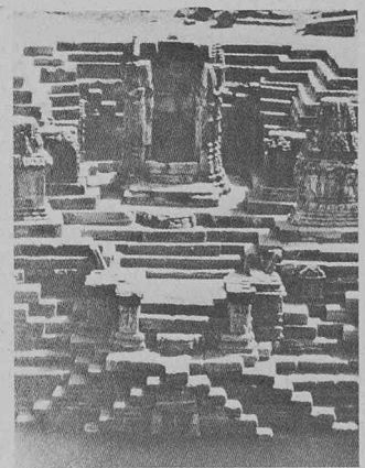
Temple et réservoir à Modhera (Inde).

Ces expositions sont organisées au département d'architecture de l'EPFL, avenue de l'Eglise-Anglaise 12, à Lausanne.