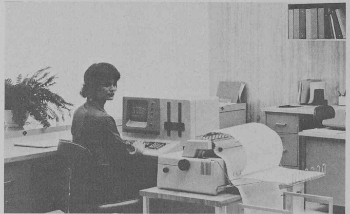
L'ordinateur compact IBM 5120 : conçu pour les petites entreprises, ce système autonome est offert avec des programmes d'application permettant d'exécuter les travaux administratifs les plus courants.

IBM Suisse annonce aujourd'hui le système le meilleur marché qu'elle ait jamais commercialisé, l'ordinateur compact IBM 5120, dont la livraison débute immédiatement. Son prix plancher de 19 663 fr. marque un pas important dans la voie de la réduction du coût de la puissance informatique. En effet, bien qu'à peine plus volumineux qu'une machine à écrire, le 5120 n'en possède pas moins la puissance de calcul d'un ordinateur qui, il y a vingt ans, aurait pesé une tonne et rempli un local de sept mètres sur dix. Le 5120 est aussi plus facile à utiliser. Il se compose d'un écran de 23 cm de diagonale, d'un clavier de machines à écrire complété par un clavier de machine à calculer, d'une mémoire secondaire à minidisques de 2,4 millions de caractères et d'une mémoire principale acceptant, selon le modèle choisi, de 16 384 à 65 536 caractères d'information.