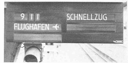
Fig. 5. — Affichage des départs de train à Zurich-Oerlikon.

L'installation des indicateurs de départ (type Solari) contrôlée par ordinateur, comprend 24 appareils d'affichage à Oerlikon (fig. 5), 8 à Wallisellen ainsi que 48 appareils simples et 3 appareils collectifs pour informer les voyageurs. A Oerlikon et dans toutes les gares du rayon d'action, des haut-parleurs sont installés, contrôlés soit localement soit