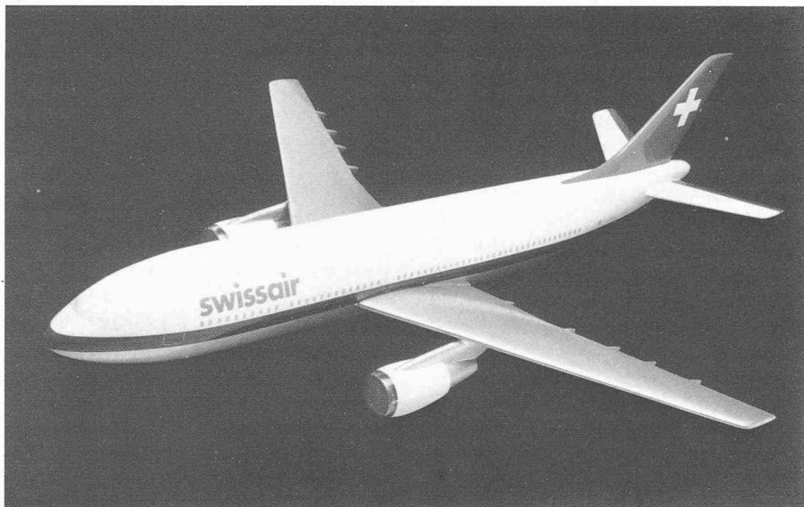
Fig. 1. — La Swissair a commandé dix Airbus A 310.

L'ouverture de la gare ferroviaire de l'aéroport de Zurich-Kloten se situe dans la ligne de ces efforts. Désormais le plus grand aéroport de Suisse, où près de 8 millions de passagers ont transité en 1979, sera directement relié au réseau de trains express suisses. Cet événement est l'expression d'une coopération bien comprise, qui tient compte à la fois des