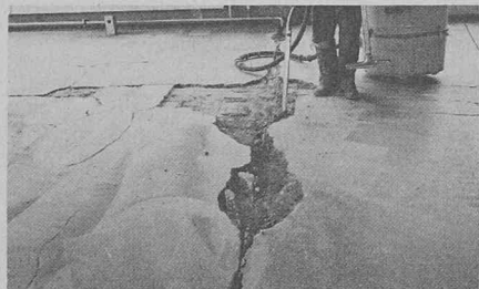
Chape ciment présentant de nombreuses fissures, trous, effritement, etc.