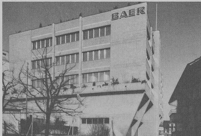
Pour sa nouvelle unité de production de Küssnacht/Rigi, le plus grand fabricant suisse de fromage à pâte molle, E. Baer & Cie, a opté pour un programme d'économie d'énergie mûrement étudié. Avec la réutilisation de la chaleur du système de chauffage, une isolation conséquente et des vitrages Thermoplus , il est parvenu, en janvier 1980, à économiser approximativement 18 000 litres d'huile de chauffage comparativement à l'année précédente.

trées avec Thermoplus ne coûtent en outre pas beaucoup plus cher que des fenêtres spéciales à vitrage triple. L'investissement consenti s'amortit rapidement ; pour une villa familiale placée dans les conditions climatiques d'Europe centrale, des fenêtres