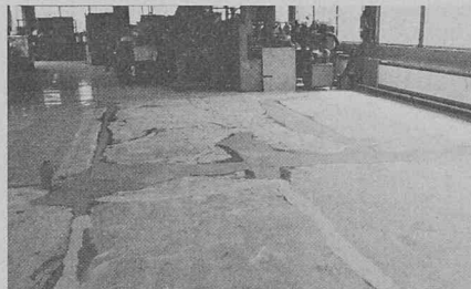
Réagréage des sols précités au moyen de masses epoxy Famaflor.