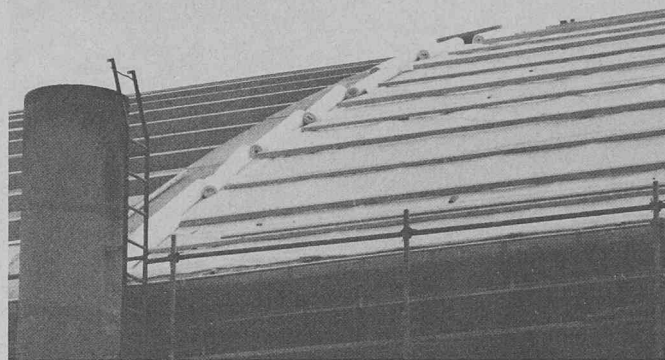
Contre-lattage avec plaques transparents en polyester.

Les constructeurs et projeteurs recherchent de plus en plus des matériaux qui soient à la fois fonctionnels et avantageux. La sous-toiture Monarflex SPF constitue un produit économique de plus en plus demandé, car il répond à l'exigence d'un prix avantageux, d'une mise en œuvre fort simple et d'une efficacité à 100 %.