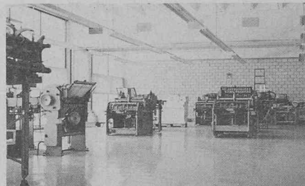
Revêtement Famaflor appliqué sur sol béton consolidé avec masses epoxy.

nistratifs et commerciaux, voire même des sols antistatiques pour salles d'opération ou laboratoires. Les anciens fonds présentant une dégradation avancée tels que fissuration, trous ou usure dus à un fort roulement peuvent être remis rapidement en état avec les masses Famaflor. Ce travail s'exécute en un temps minimal sans perturber la bonne marche de l'entreprise.