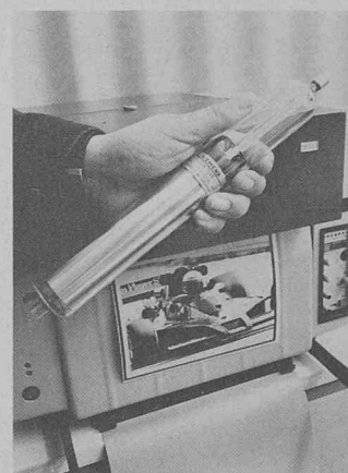
Ce tube est utilisé dans le nouveau récepteur de téléphotos TM 4006 de la société Dr.-Ing. Rudolf Hell GmbH. Le rayon laser reproduit la photo sur du papier « dry-silver » en rouleau. Un système automatique de développement thermique permet d'obtenir la photo définitive.

Les téléphotos transmises sur fil jusqu'au récepteur peuvent être modulées en fréquence (FM) ou en amplitude (AM). La transmission par radio se fait uniquement en modulation de fréquence. Quel que soit le procédé de modulation utilisé, la qualité de l'image dépend essentiellement de la modulabilité du récepteur. Il faut également que l'intégralité de la plage de luminosité soit restituée avec une parfaite graduation du noir au blanc, même lorsque les originaux sont mauvais. En mettant au point une géométrie spéciale de résonateur et en modifiant la pression de gaz, Siemens est parvenu à porter à 100 % la modulabilité des tubes laser, assez réduite jusqu'ici. Pour une puissance de sortie de 0,4 mW, le nouveau tube HeNe du type LGR 7625 a 298 mm de long et 36 mm de diamètre.