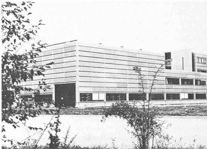
La nouvelle halle des structures de l'EPFL, qui abrite désormais le laboratoire de l'ICOM.

Définissant ensuite le rôle de son Institut, le professeur Badoux a illustré la façon dont peut être assurée cette activité de caractère essentiellement scientifique, par l'intégration aux autres tâches de l'ICOM. La première, au sein du Département de génie civil de l'Ecole, est évidemment l'enseignement. La valeur de ce dernier est toutefois tributaire aussi bien de celle des recherches effectuées que d'un contact avec la pratique. En effet, dans le domaine de la construction, où notre pays s'est illustré par les réalisations de nombre de grands