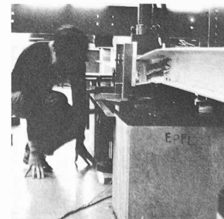
Détermination de la résistance d'une poutre métallique par un essai de charge jusqu'à la rupture, soit environ 30 tonnes.

Fidèle à sa vocation de susciter les contacts, le professeur Badoux donnait ensuite à ses hôtes l'occasion d'une sympathique rencontre entre participants, lors de l'apéritif offert dans les nouveaux bureaux de l'ICOM. Les discussions entre enseignants, chercheurs, ingénieurs de la pratique, patrons, employés ou fonctionnaires, chefs d'entreprise et amis de l'ICOM y ont été nourries et cordiales, à l'image de toute cette manifestation. Nous nous associons aux félicitations qui y ont été présentées au professeur Badoux et à ses collaborateurs. WL