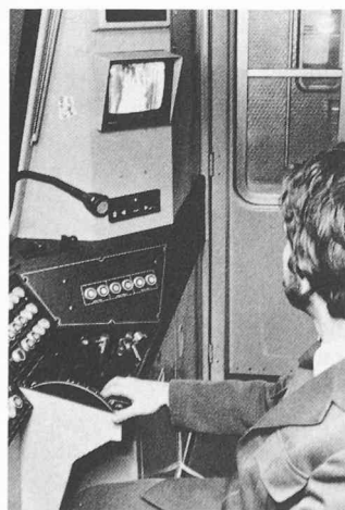
La photo montre la cabine de conduite d'une rame du métro d'Amsterdam. Sur l'écran de son moniteur, le conducteur peut observer les mouvements sur le quai, les montées et descentes des voyageurs grâce aux images transmises par une installation de télévision sans fil de Siemens.

L'exploitation des réseaux métropolitains et des réseaux express régionaux ne devient vraiment rentable que si elle se satisfait d'un effectif réduit de personnel et si le déroulement du trafic bénéficie d'une automatisation poussée. Dans cet objectif, Siemens a développé pour ces moyens de transport un système de télévision en circuit fermé dont la mise en œuvre, tout en garantissant absolument le même niveau de sécurité, contribue à une compression du personnel d'exploitation. Une telle installation de télévision à transmission des images par voie radio-électrique vient d'être mise en service dans le métro d'Amsterdam.