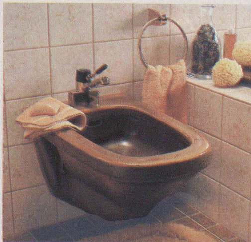
Exemples tirés du programme Mobello, coloris « terra ».