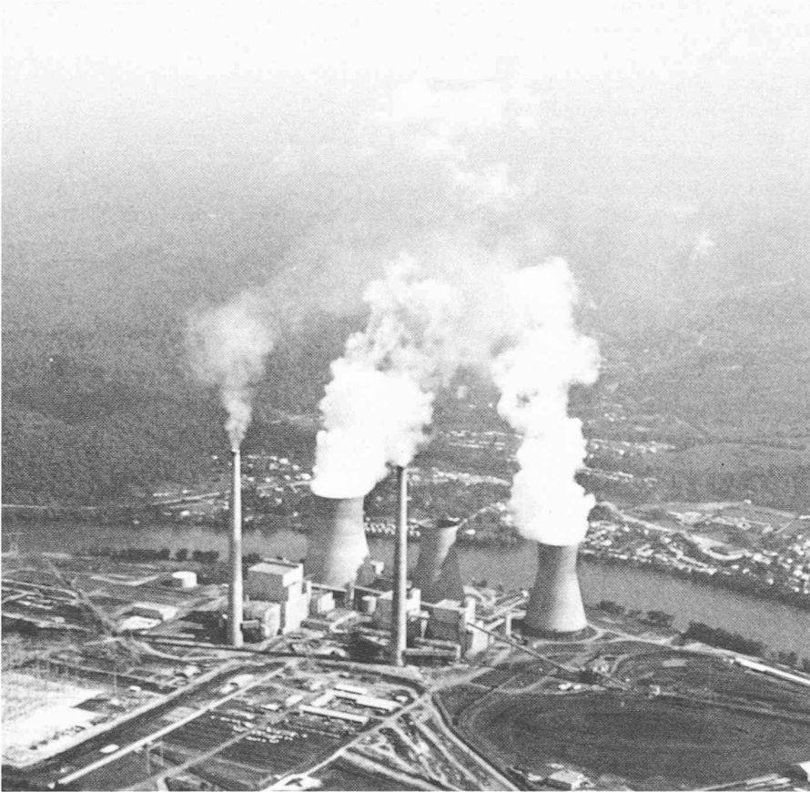
Centrale à houille Amos 3 (USA). La centrale de gauche (turbine de 1300 MW et 2 générateurs de 122 MVA) correspond à ce qui est envisagé pour Bâle. Cette photo préfigure une installation sur les bords du Rhin, où la région est toutefois beaucoup plus fortement peuplée.

scories et 355 000 tonnes de cendres. Sur l'ensemble de la période d'activité escomptée de 25 ans, il résulterait 9,7 millions de tonnes de résidus, ou environ autant de mètres cubes. De quoi recouvrir les 39,5 hectares du complexe sportif de Saint-Jacques d'une couche de cendres de 24,5 mètres de hauteur, ce qui correspond à celle d'un immeuble de 9 étages. Ce n'est pas tout : les cheminées des deux tranches de la centrale cracheraient en outre chaque année près de 5,9 millions de tonnes de gaz carbonique ( \text{CO}_2 ), 600 tonnes d'oxyde de carbone toxique (CO), 46 000 tonnes d'anhydride sulfureux ( \text{SO}_2 ), 760 tonnes d'anhydride sulfurique ( \text{SO}_3 ), 13 500 tonnes d'oxydes nitriques ( \text{NO}_x ), 990 000 tonnes de vapeur d'eau (sans compter les 14,3 millions de tonnes issues des tours de refroidissement), ainsi que 4000 tonnes de cendres volantes très fines qui contiennent aussi des substances radioactives (plomb 210 et radium 226).