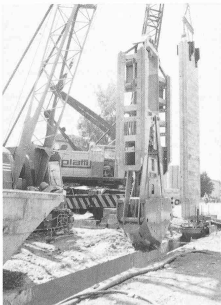
Fig. 2. — Creusage d'une tranchée et mise en place d'un élément de paroi préfabriqué.