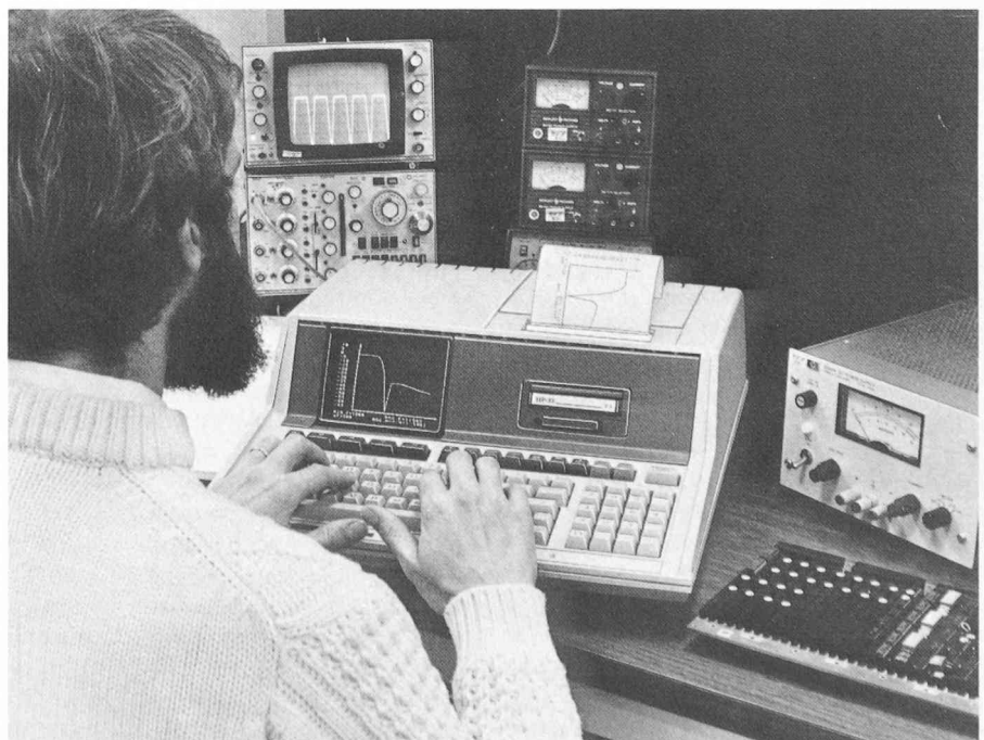
Fig. 3. — L'ordinateur personnel Hewlett-Packard HP-85.