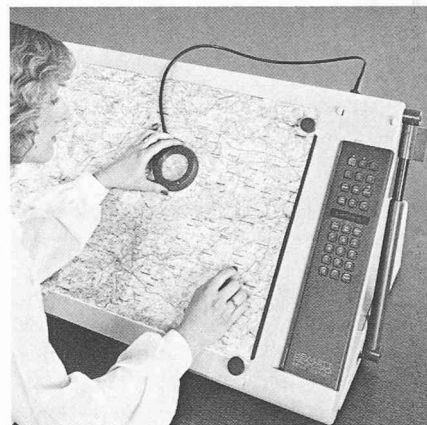
Fig. 1. — Lecteur de coordonnées permettant la conversion de données graphiques en données numériques (Hewlett-Packard HP-9874 A).

Le développement des applications professionnelles pourra être plus rapide, la souplesse d'utilisation des ordinateurs personnels offerts sur le marché jouant un grand rôle.