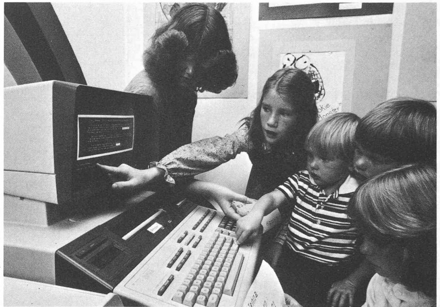
Fig. 2. — Aujourd'hui déjà, les élèves de primaire dialoguent avec l'ordinateur, une génération après qu'il a fait son apparition dans les instituts de mathématiques des hautes écoles, où son usage était limité à quelques spécialistes ! (Denver Children's Museum, USA).

Au début de cette année, la maison américaine Hewlett-Packard a causé une certaine surprise en faisant son entrée sur ce marché considéré comme marginal. Cette arrivée est la conséquence d'une analyse de l'évolution probable de ces prochaines années, principalement dans le domaine professionnel, des ordinateurs personnels. C'est avec le plus