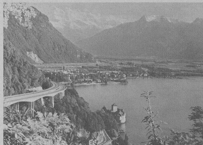
A Montreux, les Dents-du-Midi (alt. 3257 m), témoins importants de l'histoire de la topographie, s'offrent aux regards des congressistes venus de tous les pays.

L'esprit d'invention et le travail de précision suisse ne sont fina-