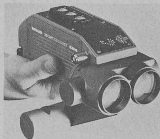
Le plus petit distancemètre réducteur infrarouge du marché mondial, le D1 4L Wild, est électronique; il perpétue la tradition Wild dans un nouveau domaine d'application.

Après que le travail du géomètre a été facilité dans le terrain par