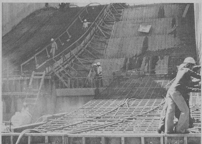
Sur le plus grand chantier du monde, à Itaipu, les ingénieurs se fient entièrement au niveau Wild N2, muni d'une nivelle à double face unique en son genre, conçue par l'inventeur suisse.

L'Informap, système graphique interactif de banque de données et de restitution, et le Geomap, système interactif de mensuration, se situent à l'échelon le plus élevé de l'automatisation. Informap travaille par exemple selon le principe de la carte numérique dynamique. Les données géométriques et administratives, localisées, sont mémorisées jusqu'à 127 niveaux dans un ordinateur et disponibles en plusieurs combinaisons sur simple pression d'une touche qui appelle un plan ou un registre. C'est ainsi que les citoyens, les autorités et les entreprises disposent d'informations mises à jour dans les domaines les plus divers: tracé d'une conduite souterraine préférentielle dans le réseau de canalisation urbain, emplacement et étendue des zones de verdure, limites des biens fonciers, valeur marchande des terrains, nombre d'étages des édifices, etc. Les économies réalisées avec de tels systèmes sont très importantes. Ce thème très actuel figure dans le cadre du Congrès de Montreux, à l'ordre du jour d'une commission spéciale, sous le nom de «Systèmes d'information du territoire»; ils sont de plus en plus en vedette en raison des banques de données qu'il faut assimiler. Ces systèmes auront une grande influence sur les projets futurs.