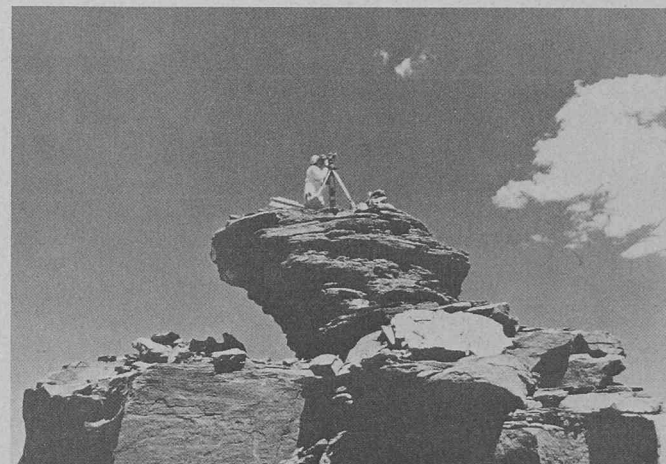
Les géomètres du monde entier mesurent au moyen d'instruments de géodésie fabriqués en Suisse. Les travaux de triangulation nécessaires à une nouvelle carte de la région la plus intéressante d'un parc national situé dans le Grand Canyon en Arizona (USA) ont été faits avec un théodolite de précision Wild T3, le même dont on s'est servi pour mesurer l'altitude du sommet de l'Everest.

Heinrich Wild et les récentes découvertes en électronique, de nombreuses tâches relatives aux traitements des données, calculs, dessins des plans et cartographie se font dans le bureau de géomètre. C'est là une évolution des méthodes de travail qui commence déjà et qui se manifestera prochainement. Certains aspects de ces nouvelles conceptions seront des «premières» pour le Congrès de Montreux; elles se caractérisent par une augmentation sensible du rendement.