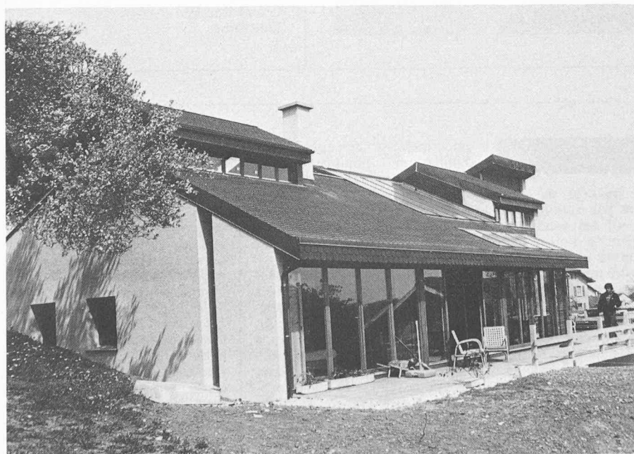
Fig. 1. — Façades ouest et sud.

La construction est en maçonnerie lourde, pour les murs et en dallage de terre cuite pour une masse thermique optimale. L'enveloppe du bâtiment est entièrement isolée à l'extérieur, même la partie enterrée, la terre n'étant pas un