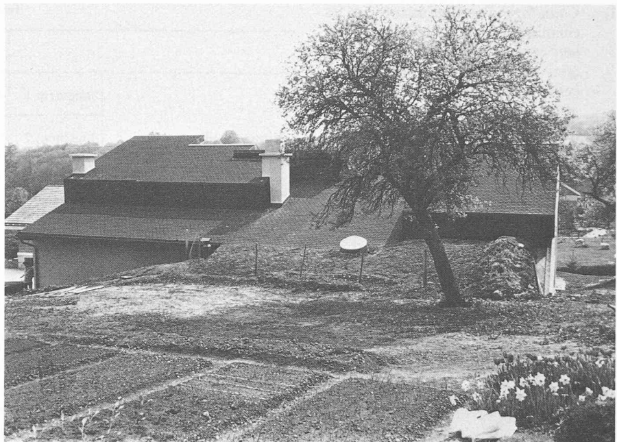
Fig. 3. — Vue prise du nord.

L'excédent dans la serre est particulièrement sensible en octobre, mars, avril et mai. Ce résultat dans notre climat est favorable, puisque pendant ces mêmes mois le gain direct par les façades sud est plus faible. Cet excédent constitue une source de chaleur gratuite pour les deux habitations.