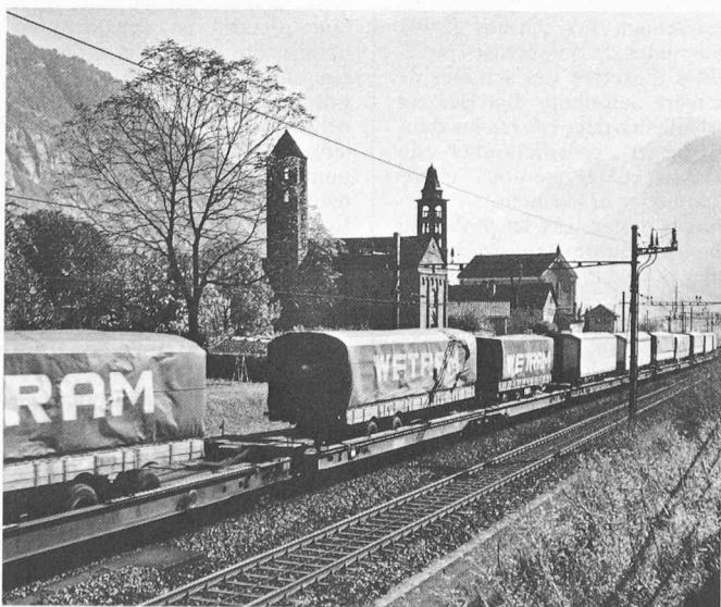
La coordination des transports et l'économie d'énergie sont étroitement liées: le ferroutage en est un excellent exemple.

Le contrat d'entreprise qui vient d'être établi définit la mission des CFF et les diverses prestations de service public qu'ils sont tenus de fournir ainsi que la façon d'indemniser équitablement celles-ci. Pour le reste de leur activité de transport, il doit bénéficier de la plus grande liberté commerciale possible, afin qu'ils parviennent au mieux à une ges-