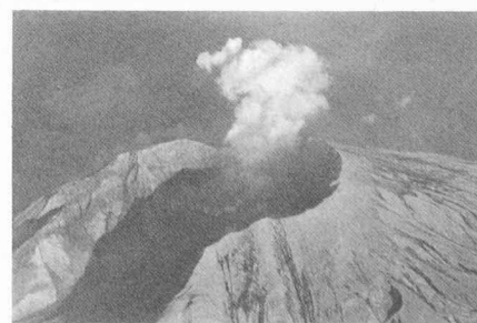
L'éruption du Mont St. Helens vue d'avion.

Cette conférence durait 2 semaines et était en fait très compartimentée, se répartissant simultanément en différents points, ce qui obligeait à des choix.