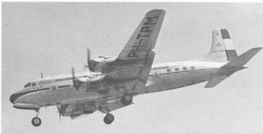
Fig. 7. — Comme le DC-1, le DC-4 s'est révélé capable de développements conduisant à la naissance de toute une série de types. Ici, le DC-6A, à cabine pressurisée.

rie de types plus grands, plus rapides et plus puissants en a été développée, soit les DC-6 et les DC-7, chacun comportant différentes versions, toutes équipées de cabines pressurisées, contrairement au DC-4.