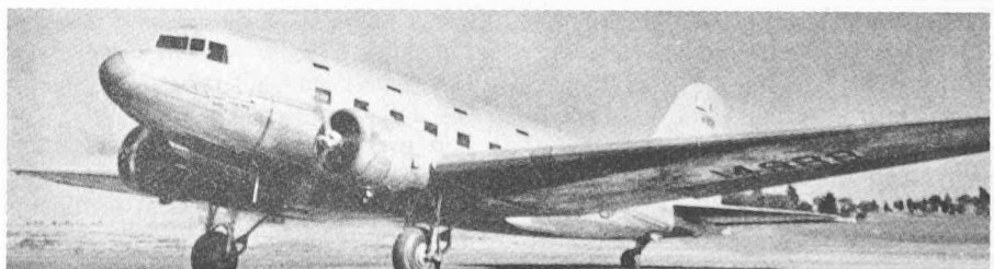
Fig. 3. — Premier d'une lignée de plus de 10 000 exemplaires (sans compter ceux construits en URSS), ce Douglas DST a effectué son premier vol le 18 décembre 1935 à Santa Monica (Californie).