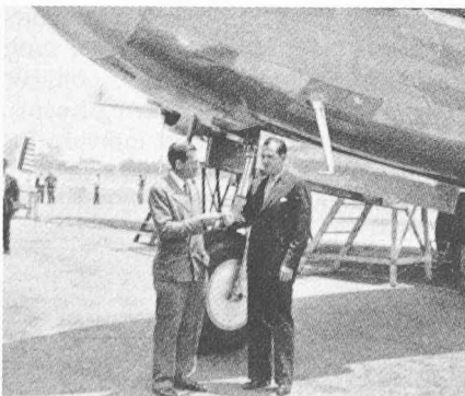
Fig. 4. — Donald Douglas (à gauche) devant le prototype du DC-4, qui a été l'un des premiers avions de transport équipé d'une roue de proue.

En 1938, 80% du trafic aérien des USA était assuré par des DC-3: les performances, la stabilité, la robustesse d'entretien, la rentabilité de ce type avaient conquis passagers, compagnies aériennes et techniciens. Si la carrière commerciale du DC-3 fut interrompue par la guerre, ce fut au bénéfice d'une carrière militaire: plus de 10 000 exemplaires en furent construits de 1939 à 1945. Là aussi, l'essentiel des transports aériens des Alliés furent le fait des diverses versions militaires du DC-3, allant du C-47 au C-53, avec des noms aussi célèbres que Dakota ou évocateurs que Skytrain ou Skytrooper .