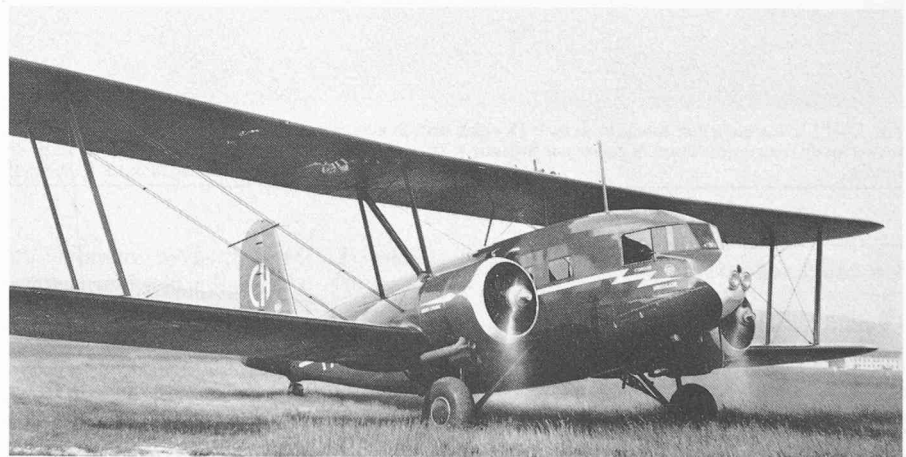
Fig. 2. — Un représentant de la génération d'avions rendus démodés par l'apparition du Boeing 247D et du DC-1: ce Curtiss-Wright Condor a fait partie de la flotte de Swissair en 1934.

Le Douglas DC-2 s'imposa d'emblée, dans le monde entier. Si l'on compare cet avion aux appareils européens contemporains, ces derniers font figure