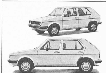
La concurrence japonaise et l'escalade du prix de l'essence ont conduit les grands constructeurs européens à rivaliser d'ingéniosité. Pourtant, les modèles qui ont vu le jour ces dernières années dans la classe des voitures petites et économiques ont nombre de points communs: traction avant, moteurs refroidis par eau (souvent montés perpendiculairement au sens de marche), abandon de la forme ponton, etc.

Ces changements doivent porter sur quatre secteurs clés: économies de dimensions, économies d'énergie, sécurité accrue, protection de l'environnement et, enfin, amélioration des méthodes commerciales.