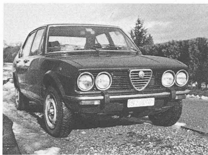
Alfa Romeo: un nom prestigieux, des qualités indéniabiles, une gestion discutable (des milliers de voitures vendues au-dessous du prix de revient), un environnement social troublé, une productivité minable. Le seul salut viendra-t-il du pays du Soleil-Levant?

millions d'Européens dépendent, directement ou indirectement, de l'automobile.