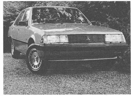
Entrée par la petite porte sur le marché européen, l'industrie japonaise s'attaque au domaine où les constructeurs du Vieux-Continent sont rois: la classe moyenne.

L'industrie automobile conserve un atout important: le fait que la voiture reste la grande passion de l'homme moderne, ainsi que le prouve sa stupéfiante progression dans notre société. De 1960 à 1976, la proportion des automobilistes par rapport à la population totale est passé de 8,3% à 28,4%. Mais le marché est maintenant proche de la saturation et la crise de l'énergie n'arrange apparemment pas les choses. Cependant, à plus long terme, elle ouvre aux constructeurs un nouveau «créneau»: désormais, c'est moins la quantité produite que la qualité obtenue qui sera le critère déterminant, en particulier sur le plan de la consommation de carburant. Préparer la voiture de demain: c'est la voie que doit suivre une industrie automobile européenne restructurée et reviv-