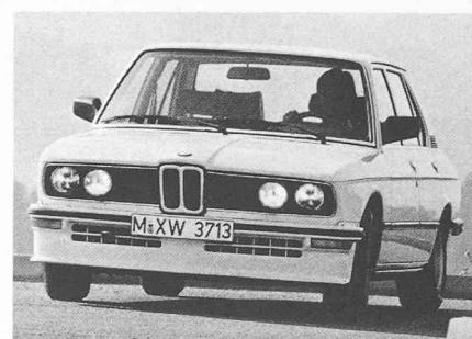
Aujourd'hui encore, les voitures «de haut de gamme» européennes se portent bien. Les acheteurs ne manquent pas pour des automobiles alliant confort poussé et technologie avancée. Pour combien de constructeurs y aura-t-il place demain? BMW (ci-dessus, BMW M535i) a pu éviter sa disparition, au début des années soixante, par l'introduction consécutive d'une technique d'avant-garde que lui ont empruntée depuis lors la plupart des constructeurs.