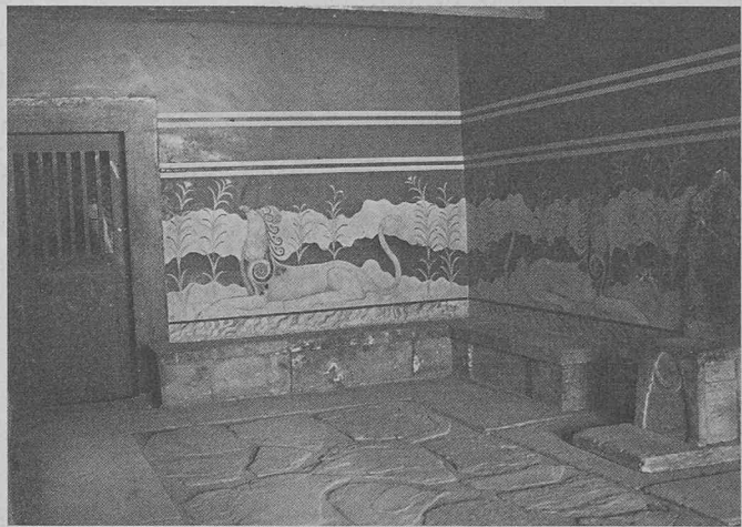
Palais ou nécropole? La salle du trône à Cnossos.

Ce manuel s'obtient auprès de Sika SA, Dépt Publicité, 8048 Zurich ou auprès des bureaux affiliés de Berne, Cadenazzo, Coire, Lausanne, Lucerne, Muttenz ou St-Gall.