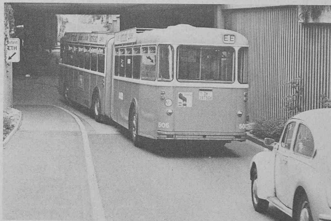
Une rame d'autobus circule dans le tunnel de l'EPFZ.

La totalité de la plaque de chaussée, environ 1600 m 2 , place d'arrêt des bus comprise, est flottante et complètement libre. L'efficacité de l'isolation surpasse les valeurs de garantie exigées.