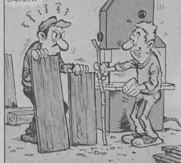
Extrait de la documentation Un métier... un avenir (menuisier).

L'EMPLOI D'OUTILLAGE DE PLUS EN PLUS RAPIDE ET MODERNE EXIGE DE LA PRÉCISION.