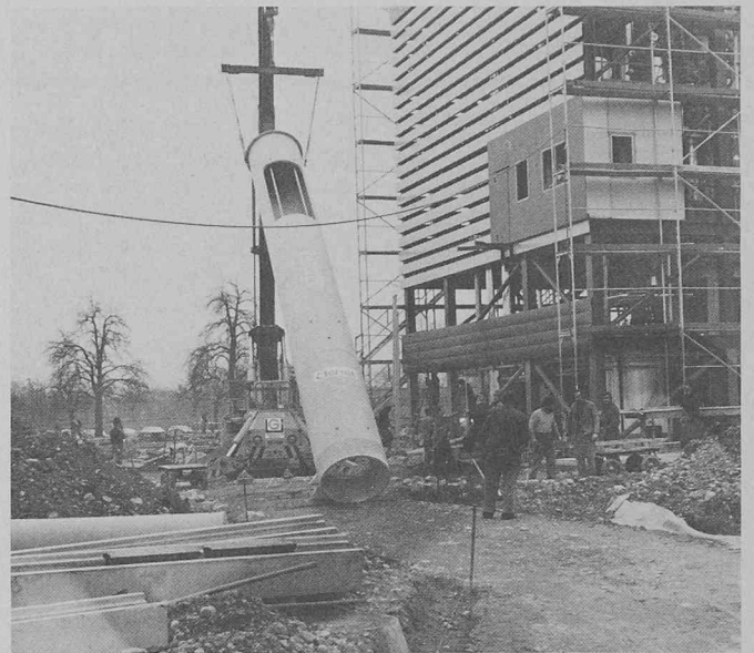
Pose en moins d'une heure: cheminée de fuite en Eternit.

L'installation de détection montée sur les plates-formes correspond à l'heure actuelle au haut de gamme de Siemens en système radial (SRS). Chaque centrale de ce système modulaire comprend 450 lignes de détection desservant chacune jusqu'à 20 détecteurs, mais pour des raisons de sécurité, le nombre de détecteurs par ligne est, en zone off-shore, bien inférieur. Sont utilisés des détecteurs d'incendie réagissant à la fumée, à la lumière et à la chaleur ou également des détecteurs de gaz sensibles aux émanations de gaz toxiques et inflammables, tel l'hydrogène sulfuré (H 2 S) qui se dégage lors de l'exploration de gisements de pétrole et de gaz. Les équipements de sécurité déclenchent également des générateurs de signaux sonores et lumineux et commandent des sprinklers, etc. Ils activent de même un système de coupure automatique («emergency shutdown»), qui arrête, en cas d'incendie ou d'émission de gaz, certaines machines embarquées sur la plate-forme ou coupe l'alimentation générale de la plate-forme de forage.