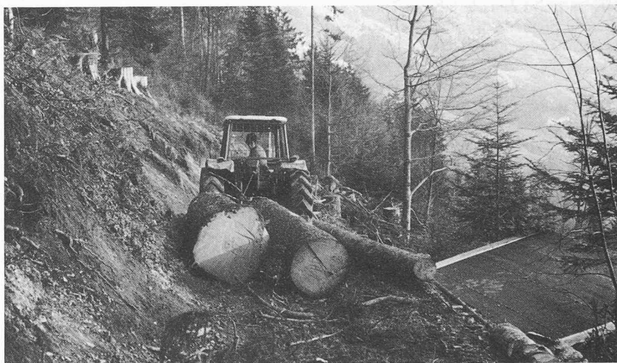
L'adaptation aux conditions actuelles de la technique et du marché est une exigence vitale tant pour l'économie du bois que pour l'économie forestière suisses.

En effet, seuls des entrepreneurs et des cadres qualifiés, familiarisés avec la technologie moderne et l'économie, peuvent relever avec succès le défi lancé par l'avenir. Du fait de ses qualités naturelles, le bois est une matière première beaucoup plus compliquée que ce qu'on a admis jusqu'à présent. C'est pourquoi