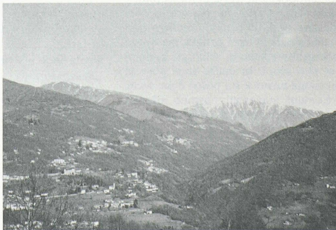
Val Colla. Il bosco è un indispensabile elemento del paesaggio ticinese e conferisce allo stesso una particolare attrattiva.