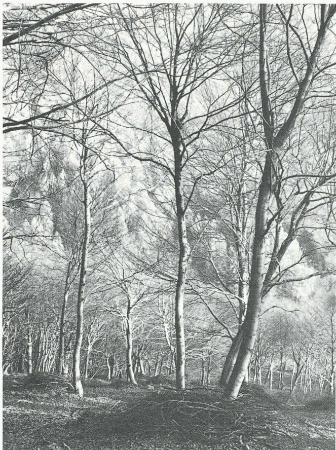
In questo bosco ceduo (faggio) è stato effettuato un taglio di conversione. Ora gli alberi possono sfruttare la luce solare in modo ottimale.