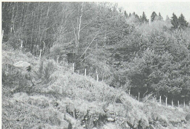
Piantazione mista in Malcantone (Arosio). La varietà delle specie presenti consente un inserimento armonico del nuovo bosco nel paesaggio.

Lo smercio del prodotto non dovrebbe essere difficile. Forse all'inizio ci potrebbero essere delle difficoltà a causa della mediocre qualità del legname, ma con il passare del tempo, grazie ai continui interventi selvicolturali, la qualità