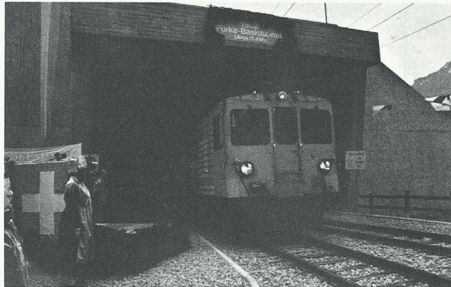
Le premier train officiel sort du tunnel de base à Realp, le 25 juin 1982.

On sait que le projet du tunnel de base avait suscité d'âcres critiques, mettant notamment en doute l'utilité de l'ouvrage. Trois mois seulement après la mise en service du transport d'automobiles